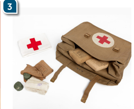
Ces objets sont présentés dans la salle « Jour J. et Bataille de Normandie »