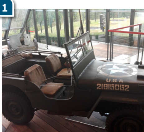
Ce véhicule est présenté au fond du hall principal du Mémorial de Caen