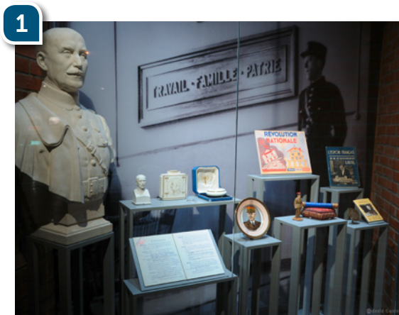
Cette vitrine se trouve dans l'espace « La France des années noires »