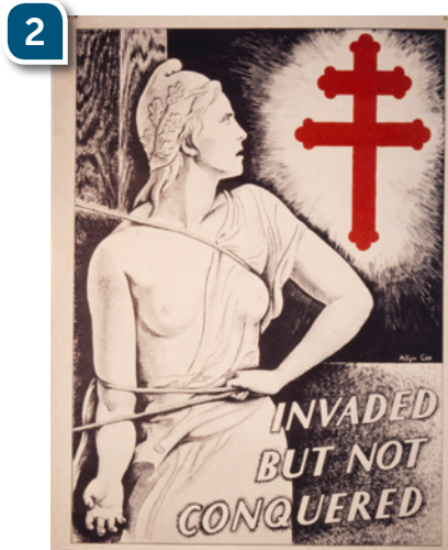
Cette affiche est présentée dans l'espace « La France des années noires ». Traduction : « Envahie mais pas vaincue »