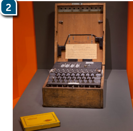
Cet objet est présenté dans l'espace « De la guerre européenne à la guerre mondiale »