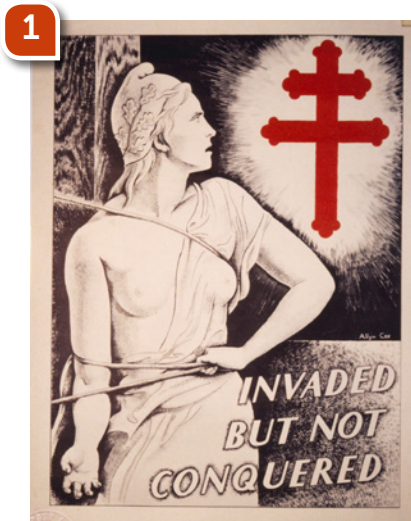
Traduction : « Envahie mais pas vaincue »

Ces trois documents sont présentés dans l'espace « La France des années noires ».